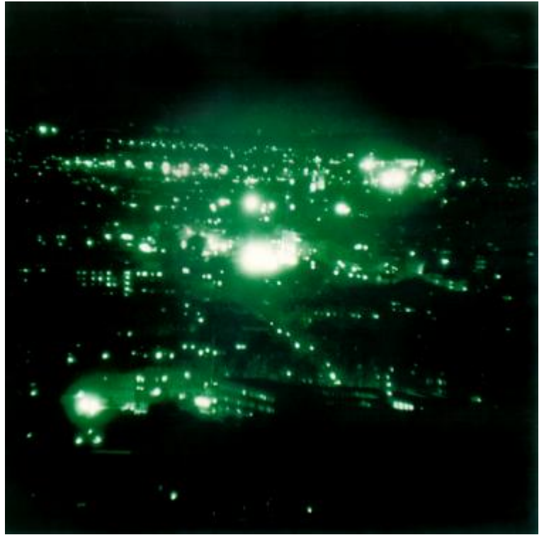
Thomas Ruff, Nacht 20 I , 1995