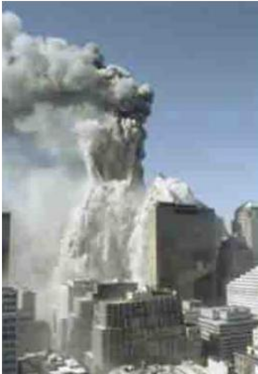
Thomas Ruff, jpg td03 , 2006